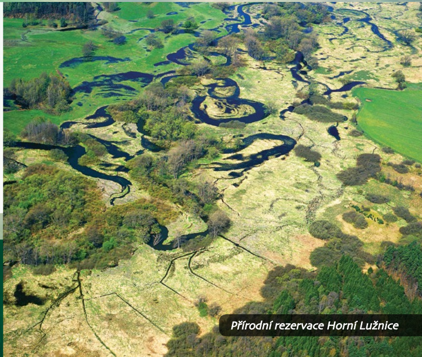
Přírodní rezervace Horní Lužnice

Přirozenou říční tepnou Třeboňské pánve je řeka Lužnice. Její voda teče Zlatou stokou, Novou řekou i mnoha dalšími stokami a zásobuje některé rybníční soustavy, stejně jako vzácné mokřady Třeboňska.