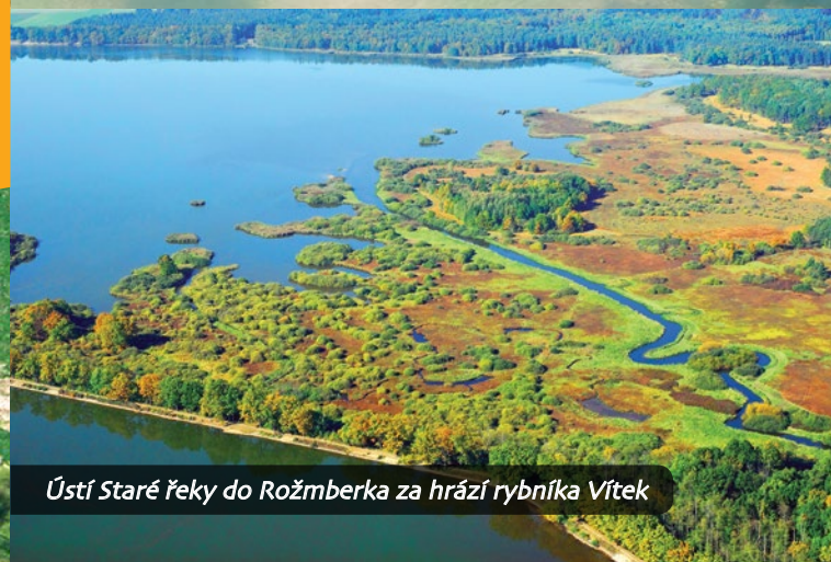
Ústí Staré řeky do Rožmberka za hrází rybníka Vítek

Vydalo: Město Třeboň © 2017, Odbor kultury a cestovního ruchu, Palackého náměstí 46/II, 379 01 Třeboň | www.mesto-trebon.cz Grafický design a sazba: Martin Štědroň Text a příprava do tisku: Marie Jirková Tisk: Westprint.cz Vydáno v rámci projektu Krajina a lidé, který je spolufinancován Státním fondem životního prostředí České republiky na základě rozhodnutí ministra životního prostředí. www.sfzp.cz | www.mzp.cz