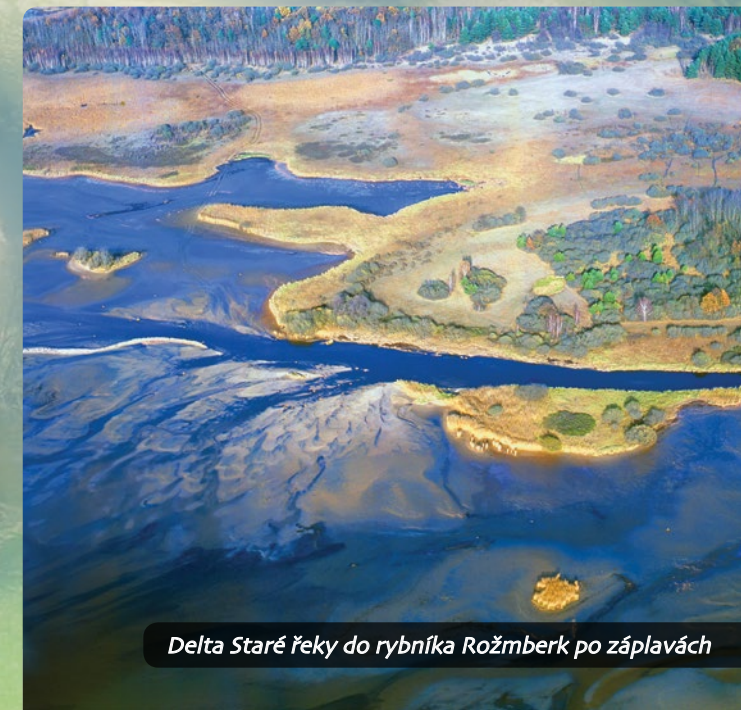
Delta Staré řeky do rybníka Rožmberk po záplavách

Stará řeka končí svou pouť v rybníku Rožmberk, kde vlivem velmi malého spádu vodního toku došlo ke vzniku říční delty, která nemá jinde na Třeboňsku obdoby. Postupem času se zde vytvořilo jedinečné území přeplavovaných luk a rozsáhlých rákosin, chráněné jako přírodní rezervace Výtopa Rožmberka .