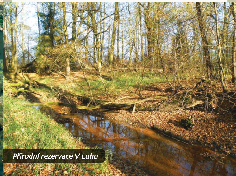
Přírodní rezervace V Luhu

Z rybníka Rožmberk část vody odtéká vedlejší výpustí Adolfkou a dále Rybniční stokou, zvanou též „Potěšilka“, která napájí rybníky Nadějské soustavy. Za hlavní výpustí pokračuje řečiště Lužnice. Přesto, že je v další části její tok zregulován, dochovala se nedaleko Frahelže významná lokalita s porosty střemchových doubrav, přírodní rezervace V Luhu .